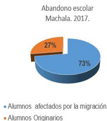
Figura 2. Comparación abandono escolar. Alumnos afectados por los procesos migratorios y originarios.

Por otra parte, el abandono escolar se da en mayor proporción entre los alumnos de padres emigrantes y los procedentes de otros lugares en comparación con los originarios, tal como se aprecia en el gráfico 2.