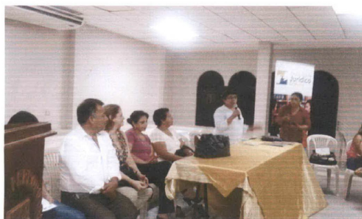
Clausura Taller de Violencia, Mujer y familia 2-07-2016

continuó el asesoramiento metodológico en la conformación de los estatutos de los consejos barriales del cantón Machala.