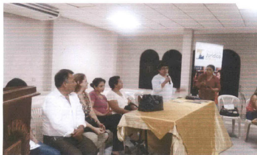
Clausura Taller de Violencia, Mujer y familia 2-07-2016

continuó el asesoramiento metodológico en la conformación de los estatutos de los consejos barriales del cantón Machala.