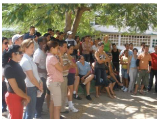
Conversatorios sobre el tema medio ambiente en Jardín martiano de la Universidad.