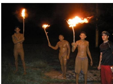
Fogata estudiantil celebrando el Día mundial del Medio Ambiente "A naturaleza viva". Representa el hombre como parte del medio natural y sus conquistas.