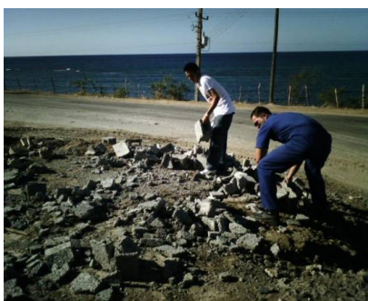
Participación de estudiantes y profesores jóvenes en actividades sociales de saneamiento y recuperación de costas Rancho Luna y Pasa Caballo