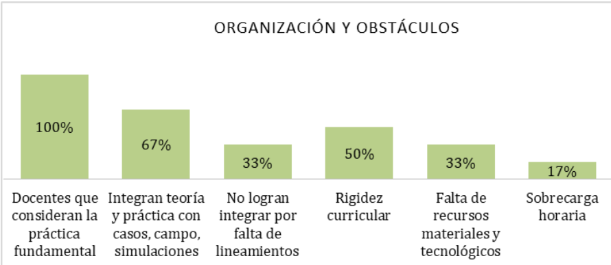
Fig 2. Resultados de la entrevista a docentes.

Valoración de la práctica. El 100% de los docentes coincidió en que la práctica es esencial en la formación técnica, destacando que la teoría por sí sola no es suficiente para preparar a los estudiantes para el entorno laboral. La práctica permite aplicar conocimientos en contextos reales, desarrollar competencias técnicas y fortalecer la autonomía profesional. Estos hallazgos subrayan la importancia de orientar la educación hacia experiencias prácticas que favorezcan la empleabilidad y la adaptación de los egresados a las demandas del sector productivo.