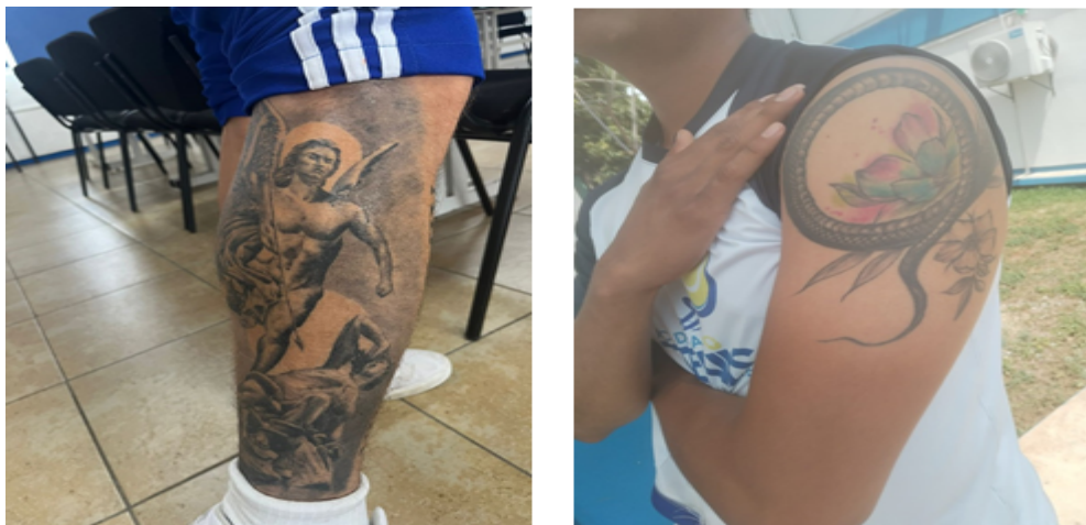
Fig 2: Tatuajes en la tibia derecha y el antebrazo izquierdo de un participante masculino