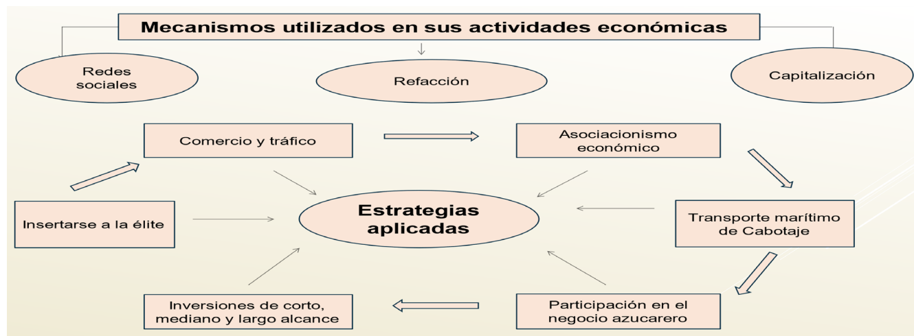
Fig 2: Mecanismos y estrategias utilizados en las actividades económicas de Tomás Terry