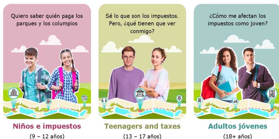
Fig 2. Elementos interactivos del portal TAXEDU de la Unión Europea.

efectividad en la enseñanza de la educación fiscal. En primer lugar, destaca por ofrecer un contenido multimedia variado, que incluye guiones gráficos y planes de lecciones, proporcionando a los profesores recursos valiosos para las actividades en el aula. Además, cuenta con un catálogo de formación que abarca cursos dinámicos e interactivos, abordando temas cruciales como el papel de los impuestos, la importancia del cumplimiento voluntario y la prevención del fraude fiscal. La inclusión del juego educativo "Taxalandia" agrega un elemento lúdico a la experiencia, permitiendo a los jugadores asumir el rol de "primer ministro" y tomar decisiones financieras relacionadas con los impuestos. Por último, la plataforma se distingue por proporcionar información actualizada sobre el desarrollo de la educación fiscal en la Unión Europea y sus estados miembros, asegurando que el contenido esté alineado con las últimas tendencias y novedades en este ámbito. En conjunto, estas características consolidan a «TAX EDU» como un modelo integral y dinámico para la promoción efectiva de la educación fiscal.