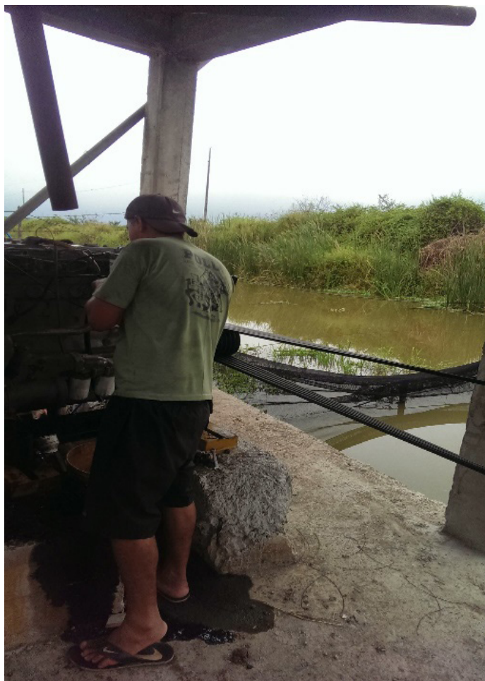
Figura 1. Mantenimiento de maquinarias y equipos con vertimientos contaminantes a las aguas.

Sumando desechos a la lista, se encuentran aquellos generados por el proceso de cultivo del camarón y otras actividades básicas, éstos aun no llegan a tener una categoría alarmante de nocividad como los anteriores residuos de maquinarias y equipos, pues generalmente se describen como suciedad, piedras, escombros, vidrio, papel, plástico, metales, entre otros.