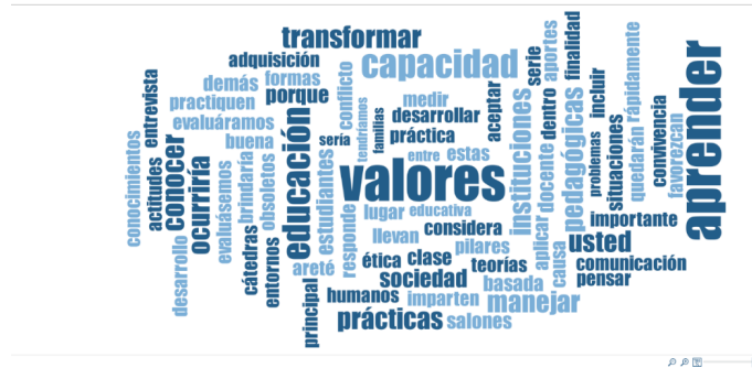
Figura 3 Esquema de los resultados obtenidos de las entrevistas a las docentes

El presente resultado se obtuvo en correspondencia al segundo objetivo y a la segunda pregunta de investigación. Para ello, se procedió con la aplicación de la técnica del focus group a los docentes con el fin de fomentar prácticas pedagógicas mediante una propuesta armónica entre el aprender a ser y aprender a conocer, posteriormente, se realizó la interpretación y el análisis cualitativo de las 10 preguntas, que se aplicaron a los educadores con la finalidad de estudiar la metodología que implementan los docentes de básica superior con las relaciones entre aprender a ser y aprender a conocer para favorecer el desarrollo de las prácticas de una educación con arete en los estudiantes de la escuela de Educación Básica El Cónдор.