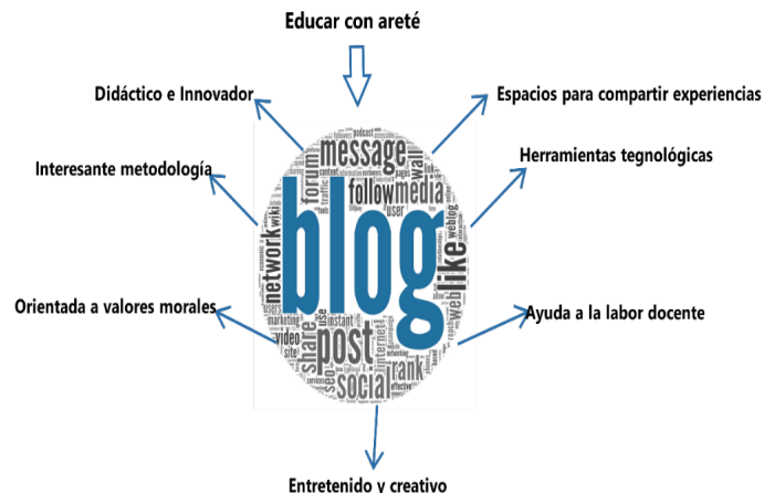
Figura 10 Tabulación de comentarios del blog desarrollado con MAXQDA

en la figura 10 desarrollada por el programa MAXQDA .