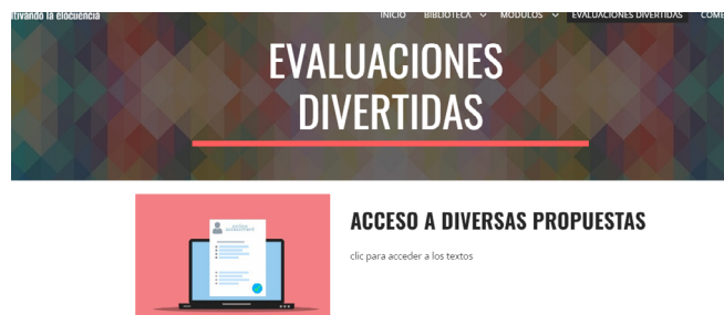
Figura 9. Acceso a diversas propuestas

En la cuarta parte, se puede apreciar en la figura 9 automáticamente la entrada evaluaciones divertidas, donde te proponemos algunas actividades educativas, por lo que se han incorporado algunas de las mejores especificaciones que incluyen: tecnología, mixtas, juegos y de arte.