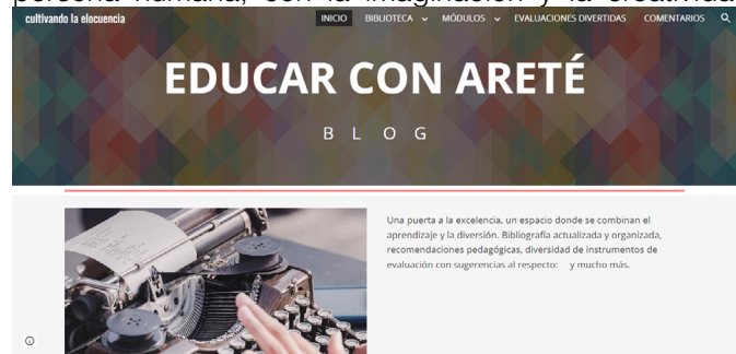
Figura 5 Estructura del blog

La presente propuesta ha sido elaborada mediante las aportaciones investigadas con diferentes actividades vinculadas a las TIC que favorezca a la educación con areté , se pretende integrar los campos del ser, y el aprender a través de conceptos, procedimientos, valores y actitudes que orientan la enseñanza y el aprendizaje. Por ello, se persigue en esta propuesta una manera diferente de contribuir con la preparación del individuo desde el desprendimiento de un materialismo educativo anticuado para hacerlos llegar a nuevos materialismos donde las ciencias juegan, se articulan, se desplazan activamente con la subjetividad de la persona humana, con la imaginación y la creatividad.