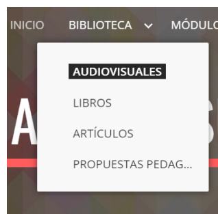
Figura 7 Contenidos de la biblioteca

En la segunda parte, en la figura 7, se visualiza el acceso inmediato sobre biblioteca: consta de algunos contenidos sobre audiovisuales, libros, artículos y propuestas pedagógicas. En la biblioteca hay diversos productos, tanto textos como audiovisuales que fueron escogidos a conciencia para que sean de agrado.