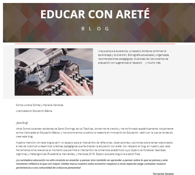
Figura 6 Entrada de contenidos de inicio del blog

para educar con areté . Su estructura consta de: inicio, biblioteca, módulos, evaluaciones divertidas y finalmente los comentarios. En la primera parte se encuentra la entrada inicio del blog: en esta sección se encuentra una puerta a la excelencia, un espacio donde se combinan el aprendizaje y la diversión. Bibliografía actualizada y organizada, recomendaciones pedagógicas, diversidad de instrumentos de evaluación con sugerencias al respecto: y mucho más. A su vez aparece la pestaña sobre la biografía de las autoras del blog para conocer un poco más de la autora del Blog. (Ver figura 6)