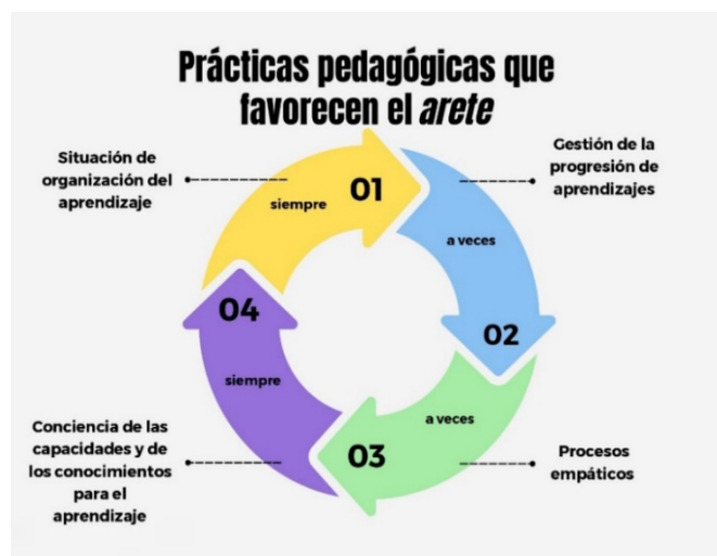
Figura 2 Esquema de resultados obtenidos en las prácticas pedagógicas que favorecen el arete