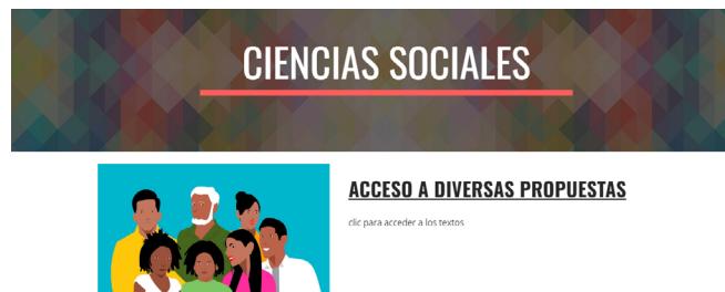
Figura 8 Ejemplo de modulo del área de Ciencias Sociales

La tercera parte, como se ve en la figura 8, está constituida por diversos módulos, este espacio permite navegar en diversas áreas relacionadas con Ciencias Naturales, Ciencias Sociales, Educación Cultural y Artística, Matemática y Lengua y Literatura. Para cada bloque hay organizado un paquete de textos que serán de mucha utilidad. Cabe indicar que en la parte inferior de cada área se tiene que hacer clic para acceder a los textos o contenidos.