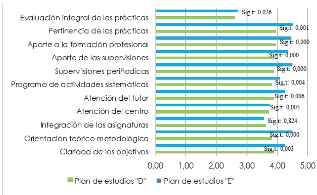
FIGURA 2. Comparación de los planes de estudio D y E