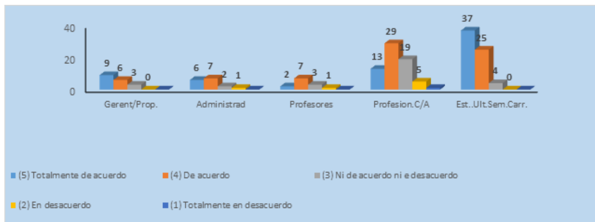
Figura 2. Representación de las respuestas de la pregunta 13.