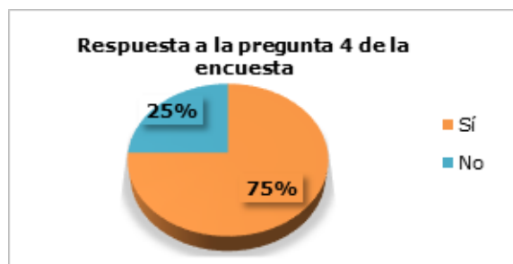
Figura 4. Respuesta a la cuarta pregunta de la encuesta.

Pregunta 4.- ¿Cree usted que se estaría vulnerando el principio de igualdad al no poseer una normativa interna como los otros cantones del país?