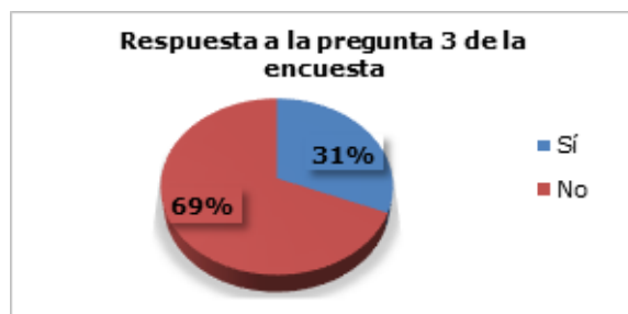
Figura 3. Respuesta a la tercera pregunta de la encuesta.

Los resultados mostrados en la Figura 3 indican que 25 profesionales de la muestra (31%) considera que el GAD realiza algunas actividades para disminuir la contaminación del agua, aun cuando no está debidamente establecida una normativa legal interna para su protección; mientras que 55 profesionales encuestados, que representan el 69% de la muestra, refiere que el GAD no se ocupa debidamente de la protección de los derechos del agua. Así mismo manifestaron que el GAD tiene poca preocupación en lo que respecta al cuidado y protección del agua, ya que, al no poseer una normativa interna, no realiza ninguna actividad que disminuya la contaminación existente.