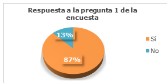
Figura 1. Resultados obtenidos en la pregunta 1 de la encuesta.

Pregunta 1.- ¿Tiene conocimiento de lo que significa una ordenanza municipal?