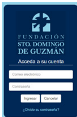
Figura 1. Formulario de ingreso.

De esta manera observamos la amplia acogida que tendrá este medio digital informativo que sería una aplicación web alcanzando un 91% del total de personas encuestadas. El aplicativo desarrollado permite al usuario buscar información referente a temas de salud, además de permitirle entrar en contacto con la fundación y con los médicos de la misma (Figura 1).