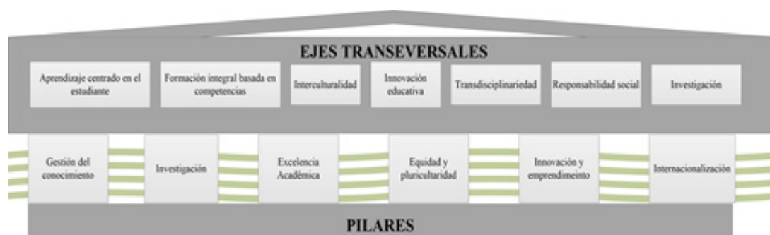
Figura 1. Pilares y ejes transversales del modelo educativo.

En el marco de la educación universitaria actual y de la sociedad del conocimiento, la transversalidad curricular constituye una alternativa para mejorar la calidad de los procesos de formación integral y el desarrollo de competencias profesionales.