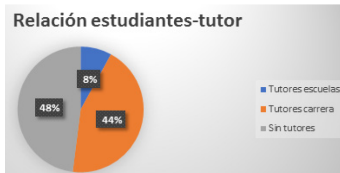
Figura 2. Relación estudiantes tutor

Se conoció su motivación por superarse en esos aspectos para el desempeño de su rol. Se comienza con una encuesta aplicada a los estudiantes donde se valora el estado de satisfacción que poseen los 70 estudiantes en formación de la carrera de Educación Primaria, de la Universidad de Cienfuegos, con relación a la tutoría de acompañamiento. Se obtiene como los resultados que se muestran en la figura 2.