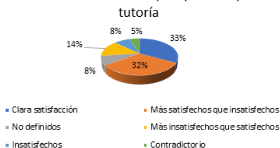
Figura 4. Satisfacción de los estudiantes, después del proceso de tutoría.

El número resultante de la interrelación de las tres preguntas nos indica la posición de cada sujeto en la escala de satisfacción, obteniendo 33% clara satisfacción, 32,7% más satisfechos que insatisfechos, 8% no definidos, 14% más insatisfechos que satisfechos, 8% insatisfechos y el 5% contradictorio.