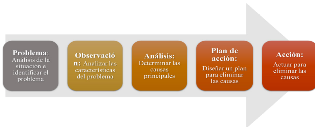
Figura 4. Orden de operaciones del MASP.

Es un proceso de mejora que presenta 8 etapas, cada una de ellas contribuye a la identificación de los problemas y la elaboración de acciones correctivas y preventivas para eliminarlos o minimizarlos (Campos, 2014). El método propone el siguiente orden en el tratamiento de problemas: