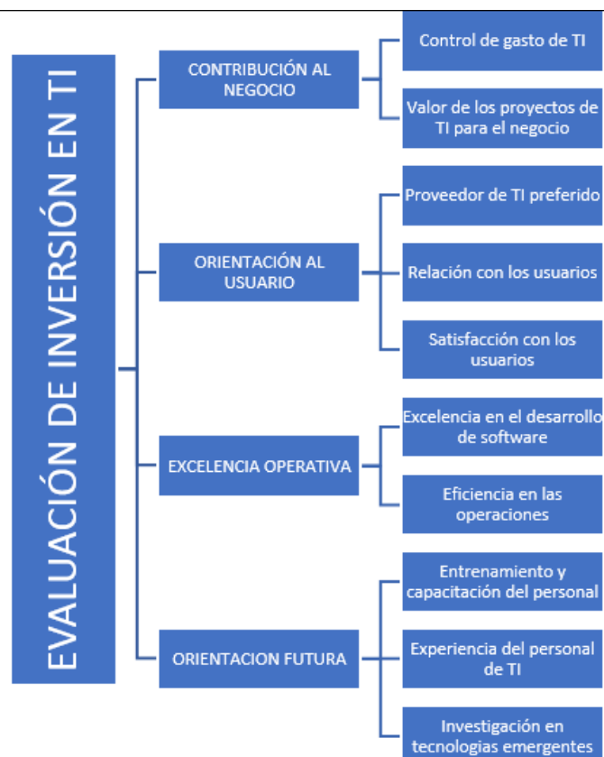
Figura 3. Modelo Evaluación de Inversión en TI basado en BSC-TI.

El BSC obtiene una puntuación alta en los punto que considera la alineación con la estrategia de la organización, justificar el valor tangible de las inversiones, desarrollo estratégicos de TI basado en la identificación de mejores oportunidades para la empresa, análisis de la causa – efecto en la transformación de los activos intangibles, el modelo BSC obtuvo puntuaciones medias en seguimiento beneficios intangibles provenientes de inversiones, alineamiento de las inversiones a la estrategia de la empresa, gestión de los riesgos de inversión en TI, estas puntuaciones permiten seleccionar al BSC como modelo principal, aún más considerando la variante BSC – TI que se ajusta a la problemática en estudio.