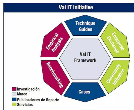
Figura 1 Iniciativa VAL IT.

VAL IT proporciona los medios para medir, monitorizar y optimizar la realización de valor de negocio a partir de la inversión en TI. El marco de Val IT se centra en la decisión de invertir (¿estamos haciendo lo correcto?) y la realización de beneficios (¿estamos obteniendo beneficios?), proporciona un complemento de procesos de soporte y otros materiales de orientación desarrollados para ayudar al consejo y a la dirección ejecutiva a comprender y desempeñar sus papeles relacionados con las inversiones de negocio posibilitadas por TI (Figura 1).