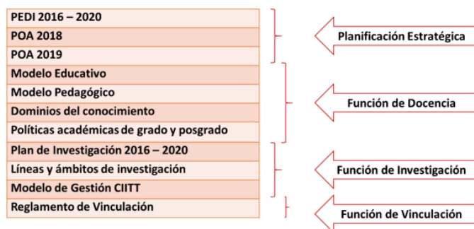
Figura 2. Fuentes para el análisis documental.

Se analizaron once documentos que contienen normativa relacionada a la ejecución de los procesos sustantivos obteniendo los siguientes resultados (Figura 2):