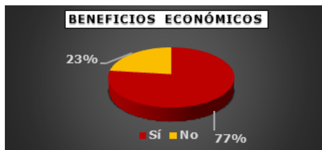
Figura 3. Expectativas económicas de la Billetera Móvil (BIMO).

En relación con la frecuencia de uso de este medio de pago se deduce que el 61% de los dueños de restaurantes de segunda categoría estarían dispuestos a utilizar "De vez en cuando" la billetera móvil como medio de pago, mientras que el 23% "Siempre" y un 8% "Nunca". Además, se deduce que el 62% de los restaurantes de segunda categoría poseen un nivel de confianza baja, mientras que el 23% alta y un 15% media; esto evidencia que la falta de información provoca un grado de desconfianza a los usuarios de este medio de pago (Figura 3).