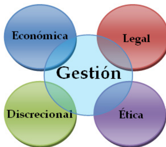
Figura 4. Responsabilidades de los administradores empresariales.

Carroll (2000), afirma que los administradores de organizaciones empresariales tienen cuatro responsabilidades, tal como muestra la figura 4: económica, legal, ética y discrecional.