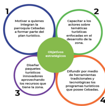
Figura 1. Objetivos estratégicos.