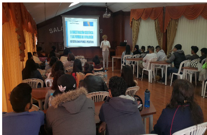
Figura 1. Imágenes sobre el desarrollo de los Seminarios.