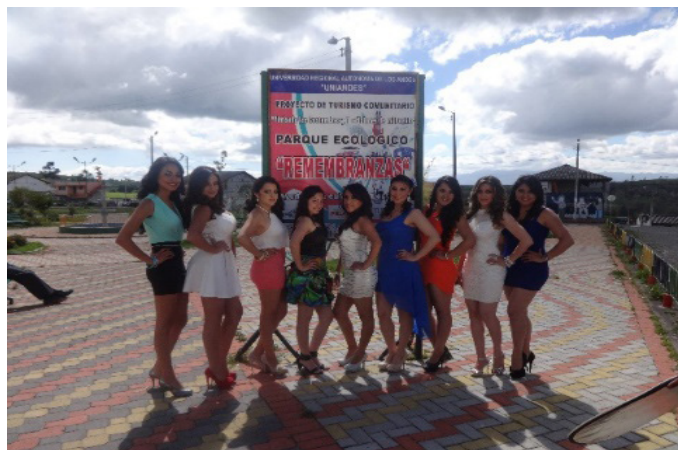
Figura 4. Evidencias del desarrollo de exposiciones.