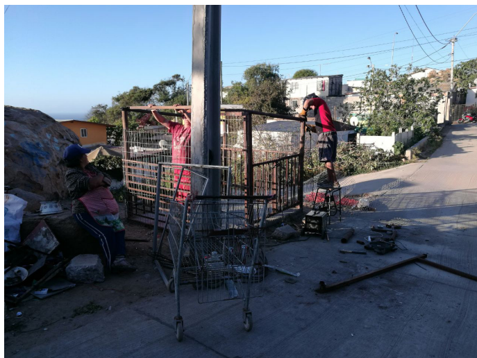
Figura 3. Construcción comunitaria de contenedores para la basura.

En Camino al Mar, realizaron además un plan de emergencia contra incendios. En este sector, la mayoría de casas existentes son de material ligero y en conjunto con los micro basurales, son un peligro inminente de incendios, principalmente en verano. Los estudiantes se dieron cuenta que la comunidad no estaba informada sobre protocolos ante desastres, por lo que señalaron rutas de evacuación y en reuniones organizaron a la comunidad indicando responsabilidades y planes de emergencia ante un siniestro. Este grupo contó con la colaboración de Bomberos, quienes realizaron una intervención sobre primeros auxilios y preparación ante desastres.