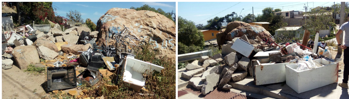
Figura 2. Micro basurales presentes en El Canelo (a) y Campamento Camino al Mar (b).

El manejo inadecuado de las basuras (Figura 2a y 2b), la formación de micro basurales y la recuperación del espacio público fue un tema que también abordaron los estudiantes en las juntas de vecinos de El Canelo y el Campamento Camino al Mar. Los alumnos concientizaron a la comunidad sobre los peligros de formación de micro basurales respecto a diseminación de roedores, enfermedades asociadas a roedores y contingencia de incendios. Los estudiantes lideraron la recuperación de espacios, movilizaron a la comunidad y recolectaron materiales para construir contenedores para las basuras. Los vecinos se encargaron de la construcción (Figura 3), al dejar áreas despejadas disponibles para el desarrollo de zonas verdes.