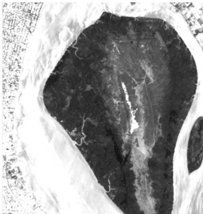
Figura 3. Foto satelital de 1967 y del 2017 de la Isla Santay.