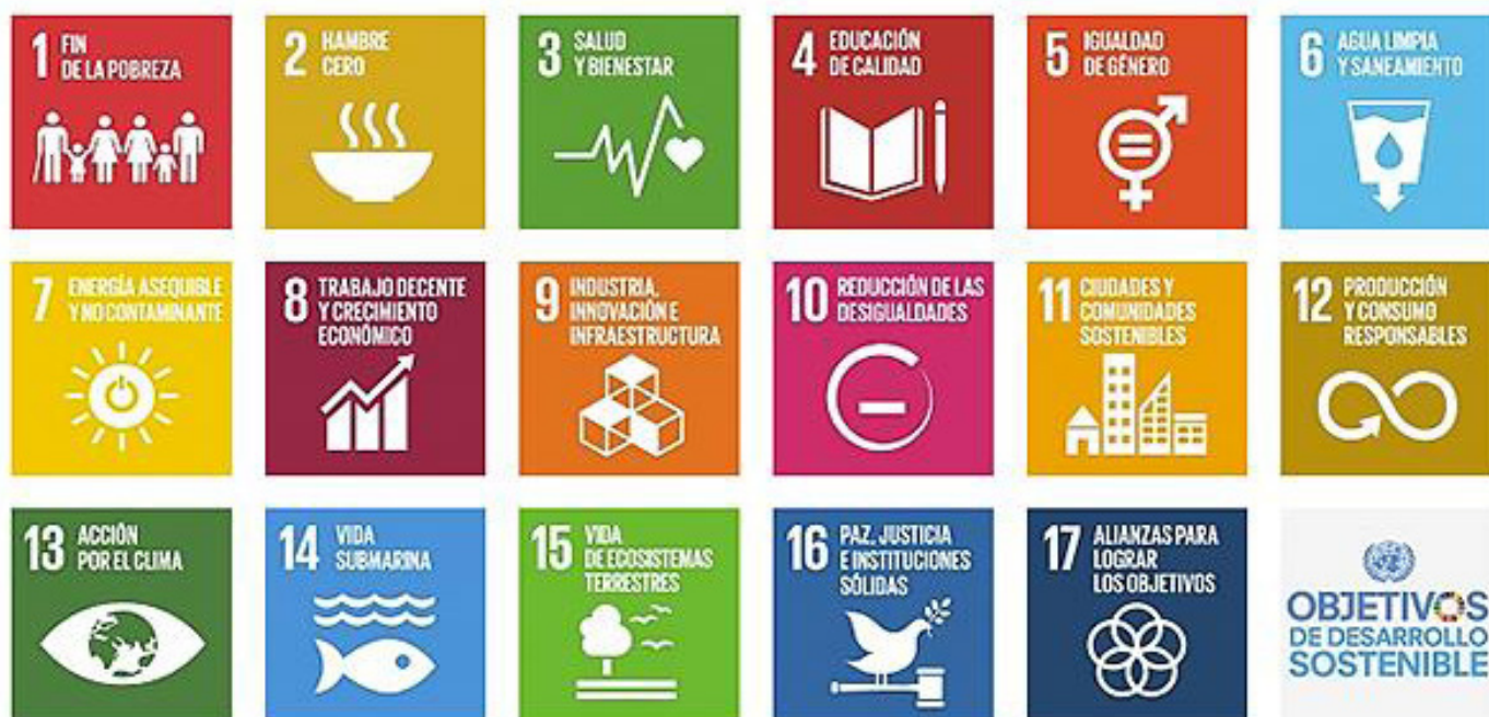
Figura 1. Objetivos de Desarrollo Sostenible de Naciones Unidas.

cultural y al medio ambiente. Se trata de proporcionar a la gente unas vacaciones emocionantes y educativas, que al mismo tiempo sean beneficiosas para el lugar elegido. La definición de Turismo Sostenible según la Organización Mundial del Turismo (2017), es: “el turismo que tiene plenamente en cuenta las repercusiones actuales y futuras, económicas, sociales y medioambientales para satisfacer las necesidades de los visitantes, de la industria, del entorno y de las comunidades anfitrionas”. Gracias a la diversidad de relaciones implicadas en la actividad turística, el turismo sostenible tiene la capacidad de actuar como catalizador de cambio en el mundo, beneficiando a la lucha de causas como el hambre, la paz y seguridad, el fomento de las economías locales. Con el fin de aumentar la concienciación de la población general y de los responsables públicos y privados sobre este tema, así como para aumentar su alcance, el año 2017 ha sido designado por las Naciones Unidas como el Año Internacional de Turismo Sostenible para el desarrollo. De esta manera, la Carta Mundial de Turismo Sostenible +20 continúa su trayectoria como vehículo del sector turístico hacia la consecución de los 17 Objetivos de Desarrollo Sostenible de Naciones Unidas.